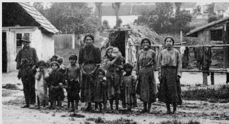
III. 4 (Mayerhofer 1988, str. 184)