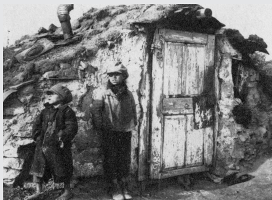
III. 2 (Mayerhofer 1988, str. 177)