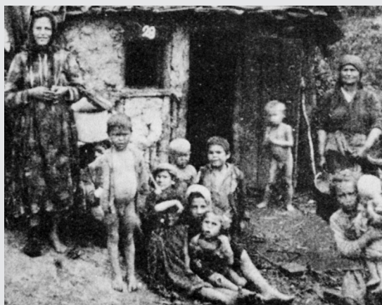
III. 3 (Mayerhofer 1988, str. 37)

Obyvatelia v Mattersburgu, Burgenland, medzi vojnami. Fotografia zachytáva tri rôzne typy obydli, ktoré vtedy existovali: naľavo, omietnutý a vybielený dom postavený z tehál, v strede “putri”, chatrč do polovice zakopaná v zemi, postavená z dreva, konárov a hliny a napravo obydlie, ktoré bolo postavené z polovičných trámov a malo hlinou vyplnené špáry.